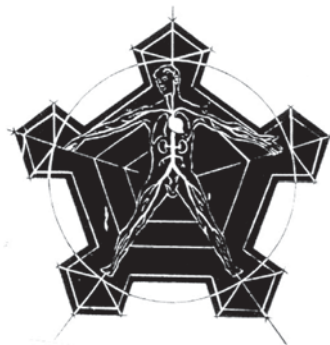
شکل ۱. نمونه‌ای از شهر رنسانسی در اروپا