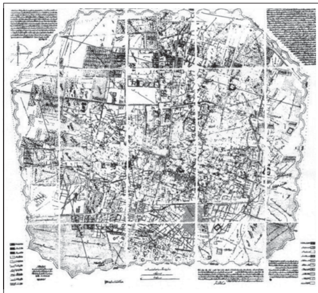
شکل ۲. نقشه تهران ناصری

در کنار عوامل بیرونی پیرامون رشد شهر و تغییرات کالبدی تهران می‌توان به عواملی همچون افزایش جمعیت تهران و احداث قصرهای سلطنتی، کوشک‌های اعیانی و سفارتخانه‌ها و منازل خارجیان در بیرون حصار و رشد محله‌های جدید پیرامون بارو نیز اشاره نمود (سعیدنیا،