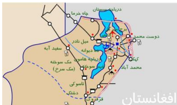
شکل شماره (۱). نقشه جغرافیایی زابل

متغیرهای مورد استفاده در این مقاله به شرح زیر است: