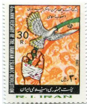
تصویر شماره (۱). تمپر چاپ شده به مناسبت سالگرد انقلاب اسلامی در دهه ۱۳۶۰

تقریباً همه نشانه‌های نمادهای باستانی و طبیعی که ویژگی دوران پهلوی بودند، از تمبرهای چاپ شده در این دهه حذف شده‌اند. همچنین، هیچ نشانه‌ای از تغییرات پیکرنگاری یا حتی تغییرات زیبایی‌شناختی در نمادها و شمایل انقلابی بر روی تمبرها به چشم نمی‌خورد؛ به گونه‌ای که نمادها و شمایل انقلابی اولیه با اندکی تغییرات تا پایان دهه ۱۳۶۰ تداوم یافته‌اند. مجموع تصاویر گنجانده شده بر روی تمبرهای دهه ۱۳۶۰، ۸۲ مورد هستند که بنا بر ملاک انتخاب، ۱۰ نماد و ۲۶ شمایل استخراج شده‌اند.