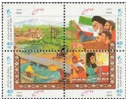
تصویر شماره (۲). تمبر چاپ‌شده در دهه ۱۳۷۰ به مناسبت سالگرد انقلاب اسلامی

بررسی نمادها و نشانه‌های مربوط به دهه ۱۳۶۰، تمایل جمهوری اسلامی ایران به درج نمادها و شمایل انقلابی را نشان می‌داد. آنچه در دهه ۱۳۷۰ اهمیت دارد، کاهش نمادها و شمایل انقلابی و درج نمادها و شمایل طبیعی، آبادانی، و ورزشی است.