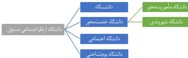
شکل ۱. شکل های دانشگاه از نظر اجتماعی مسئول

زیست محیطی، مسئولیت نوع دوستی) (علی محمدلو، اکبری و مهدویان پور، ۱۳۹۳) به شکلی درون ماندگار، در بر می گیرد. بارنت آن گاه که از این دانشگاه سخن می گوید هیچ نیازی نمی بیند که آن چه را این دانشگاه وسیعاً و عمیقاً در پیوند با ساختار درونی اش و یا در رابطه با پیرامون اش (جامعه و دولت) انجام می دهد، ذیل مقوله مسئولیت اجتماعی دانشگاه بگنجانند.