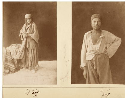
تصویر ۸. مرد لر، ضعیفه لر

دسته دیگری از تصاویر، قوم‌نگاری‌هایی از سراسر ایران است که از لحاظ فرم تفاوتی با پرتله‌های سران قاجار ندارد؛ تنها اسامی افراد حذف شده‌اند و به‌جای آن جنسیت و قومیت آنان ذکر شده است (تصویر ۸ و ۹). آنچه از آن به‌عنوان جریان شرق‌شناسی در عکاسی این دوره نام برده می‌شود تماماً در این مجموعه از تصاویر مشهود است: زنان و مردانی متنوع شده از فضای زیست خاص خود، بی‌نام و نشان، در کادرهایی عمودی و ایستا که فقط به‌واسطه نوشته زیر عکس - که قومیت را ذکر کرده است - هویت می‌یابند. زیرنویس این تصاویر تفاوتی با آلبوم‌های گیاه‌شناسی و جانورشناسی که در پی شناساندن گونه‌های زیستی متفاوت است ندارد. این مجموعه به دلیل غریب و بعید بودنش می‌تواند کاملاً در خدمت ارضای نگاه بیننده غربی‌ای (بیگانه‌ای) درآید که ظواهر متفاوت شرق برایش جذابیت دارد و نگاه جست‌وجوگرش همواره در پی کشف تیپ‌های نو و متنوع در حرکت است.