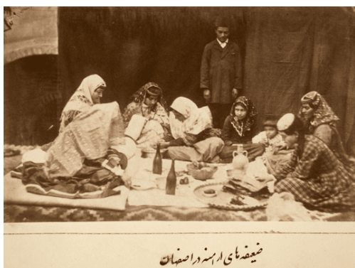
ضعیفه‌های آرامنه در اصفهان

تصویر شماره (۱۱) اتفاق کاملاً متفاوتی را رقم زده است؛ عکس بیشتر از آن که یک لحظه، یک فیگور یا قومی خاص را در کادری بسته تثبیت کرده باشد، جریانی از روزمرگی و رهایی بدن‌ها را نشان داده و عرصه را برای پروردن خیال بیننده گشوده است. در این عکس، عکاس است که به صحنه روزمرگی افراد وارد می‌شود و آن‌ها او را می‌پذیرند، نه سوژه‌هایی که از جریان زندگی خود جدا شوند و مقابل عکاس و بیننده‌ای بیگانه قرار گیرند. گرچه همچنان پانویس عکس تأکید را بر مذهب و شهر گذاشته و آن را از ارائه‌ای خالصانه از امر روزمره دور کرده، اما خود عکس به تنهایی عناصر لازم برای ارائه‌ای از فعلیت روزمرگی را داراست.