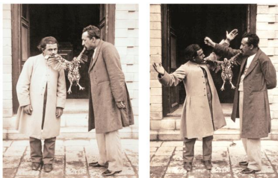
تصویر ۱۲. بدون عنوان

تلاش‌هایی برای خارج‌شدن از فیگورهای رسمی و کلیشه‌ای پیش از این در دربار آغاز شده بود (تصویر ۱۲ تا ۱۴). این عکس‌ها بدن را نه به شکل مرسوم آن، بلکه با خلاقیت‌های بیشتری ثبت کرده‌اند. این گروه تصاویر گرچه همچنان در نوع دیگری از اطوار آگاهانه گرفتارند اما تلاش آن‌ها برای خلق لحظه‌ای غیررسمی درون فضای رسمی را می‌توان مقدمه یا جریانی موازی با ثبت امر روزمره در بیرون دربار دانست. جایی که بدن در رهاترین و کم‌اداترین شکل خود مقابل دوربین ظاهر می‌شود.