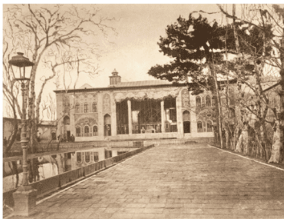
تصویر ۳. عمارت تخت مرمر دولتی

مخلّ این نمایش نباشد. از این جهت می‌توانیم در به تصویر کشیدن یک عمارت (تصویر ۳ و ۴) با مکانی مقدس مانند حرم امامزادگان و معصومین شباهتی قائل شویم. برای مثال، در تصویر شماره (۵) با ازدحام بدن‌هایی روبرو هستیم که وضوحی از آن‌ها نمی‌بینیم؛ خلق، حجاب عکس است و باید کناری بایستد. کانون و مرکزیت عکس با گنبد حرم عبدالعظیم حسنی است که کنار رفتن افراد حاضر در تصویر به برجسته‌شدن آن کمک کرده و ردیف شدن آن‌ها در دو طرف تصویر راهی برای تشریف عکاس و بیننده به ساحت قدسی حرم باز کرده است. هر دو عکس از زاویه‌ای چشم بیننده را وارد کادر می‌کند که عناصر غیرقابل کنترل تصویر (مانند درختان و چراغ) مزاحم دیدن موضوع اصلی نباشد. اهمیت نمایش کلیت امری والا در این تصاویر آنجا است که هر چیزی در راه آن باید حذف شود یا کمترین حضور را داشته باشد. این دو عکس یکی درون کاخ و دیگری بیرون از آن گرفته شده اما هر دو از یک منطق در ثبت تصویر پیروی کرده‌اند. در چنین چشم‌اندازی، امر روزمره اساساً یک حجاب است و غباری که باید کنار رود تا آن جوهره راستین رخ بنماید. چنین عکس‌هایی در رؤیت‌ناپذیر کردن امر روزمره موضوعیت دارند و تداوم همان چشم‌انداز کلاسیک و پیشامدرن هستند.