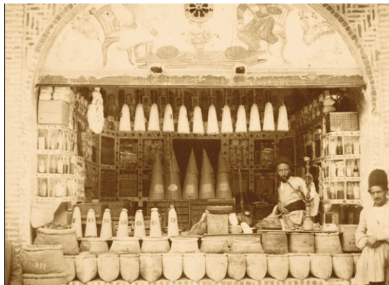
تصویر ۱۶. بازار تهران

عکاس: آنتوان سوریوگین، حدود ۱۸۸۰ تا ۱۹۳۰ آرشیو نگارخانه آرتور ام. سکлер، واشنگتن