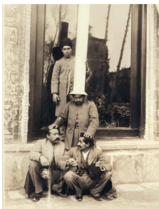
تصویر ۱۳. کاخ گلستان