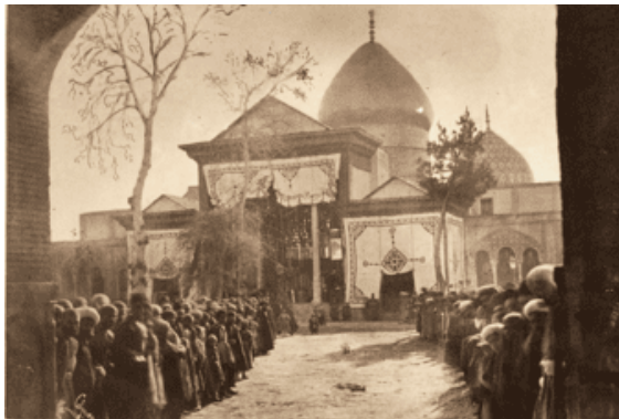
تصویر ۵. آستانه مقدسه حضرت عبدالعظیم (ع)

عکاس: آنتوان سوریوگین، حدود ۱۸۸۰ تا ۱۹۳۰