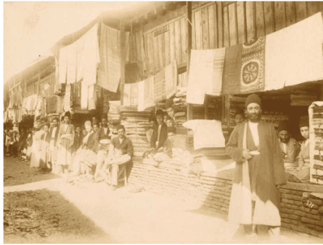
تصویر ۱۷. بازار تهران

عکاس: آنتوان سوریوگین، حدود ۱۸۸۰ تا ۱۹۳۰ منبع: آرشیو نگارخانه آرتور ام. سکلر، واشنگتن