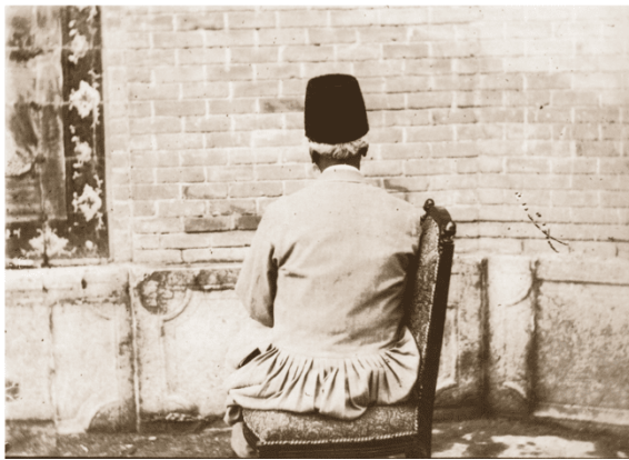
تصویر ۱۴. کاخ گلستان، مردی پشت به دوربین نشسته است.

تصویر شماره (۱۴) کاملاً در تقابل با تصاویر دسته اول قرار می‌گیرد. اگر تلاش عکاسی در آن دسته از عکس‌ها ثبت هویت، اقتدار، نام و نشان و سمت افراد است، در این عکس اتفاقی کاملاً دیگرگون افتاده و از این لحاظ آن تلاش‌ها برای دیده شدن، شناخته شدن و ماندگار شدن را به استهزا گرفته است. بازیگوشی‌هایی از این دست گرچه ظاهراً عکس‌هایی جدی و مهم خلق نکرده اما شکستن فرم‌های رایج بدن و مقاومت در برابر میلی که چهره را تنها در فیگورهای خاص به رسمیت می‌شناسد، از آن‌ها عکس‌هایی بسیار جدی ساخته است که با عکس‌های مردم کوچه و بازار وجه اشتراک پیدا می‌کند.