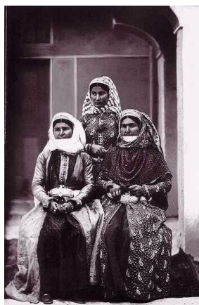
تصویر ۹. سه زن ارمنی ایرانی در اصفهان