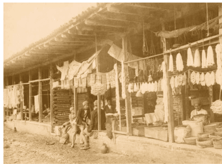
تصویر ۱۹. عکاس: آنتوان سوریوگین، حدود ۱۸۸۰ تا ۱۹۳۰ منبع: آرشیو نگارخانه آرتور ام. سکلر، واشنگتن

عکاس: آنتوان سوریوگین، حدود ۱۸۸۰ تا ۱۹۳۰ آرشیو نگارخانه آرتور ام. سکلر، واشنگتن