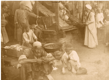
تصویر ۱۸. بازار تهران

حدود ۱۸۸۰ تا ۱۹۳۰