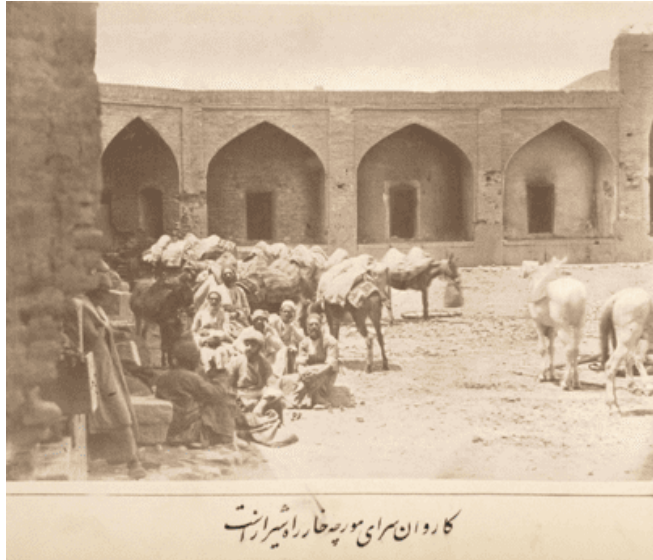
تصویر ۶. کاروان‌سرای مورچه‌خار راه شیراز است.

می‌رسد تنها حضور دوربین، افراد را متوجه خود ساخته و آنان را برای دقایقی وادار به فرم خاصی از حضور کرده است (تصویر ۶ و ۷). هرچند در این تصاویر نیز سوژه اصلی همچنان یک فضای بیرونی است که می‌تواند شهری یا غیرشهری باشد و فرد و جریان زندگی در اولویت عکاسی نیست.