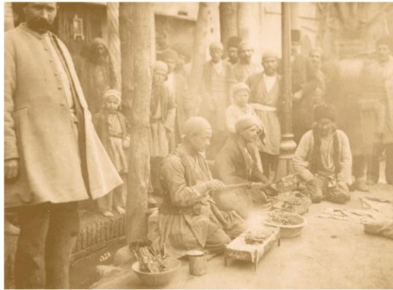
تصویر ۱۵. بازار تهران

پرسش‌گر به لنز او خیره شده‌اند. احتمالاً فعل عکاس برای آن‌ها مورد سؤال است و با توجه به تازگی تکنولوژی دوربین و از آن مهم‌تر تازگی حضور یک ثبت‌کننده در فضای به ظاهر بی‌ارزش جهت ثبت شدن، این نوع نگاه بدیهی می‌نماید و نمی‌توان آن را به ژست گرفتن، تصنعی بودن یا انتزاع یافتن از بافت زندگی و شغل خود تعبیر کرد (تصاویر ۱۵ تا ۲۱).