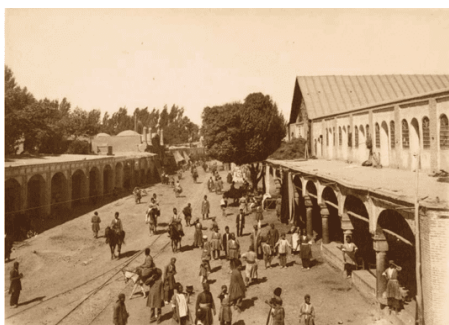
تصویر ۲۰. خیابانی در تهران

عکاس: آنتوان سوریوگین، حدود ۱۸۸۰ تا ۱۹۳۰ منبع: آرشیو نگارخانه آرتور ام. سکالر، واشنگتن