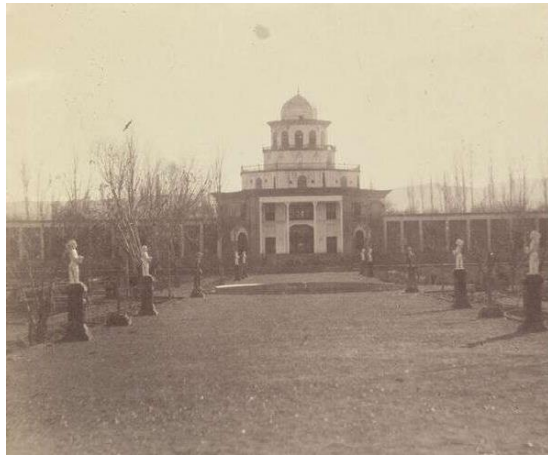
تصویر ۴. آذربایجان