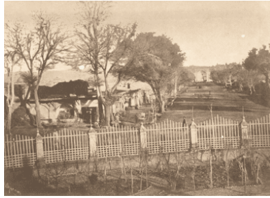
تصویر ۷. خیابان وسط شهر قزوین

حدود ۱۸۸۰ تا ۱۹۳۰