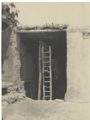
تصویر ۲۱. کارگاه بافندگی

حدود ۱۸۸۰ تا ۱۹۳۰