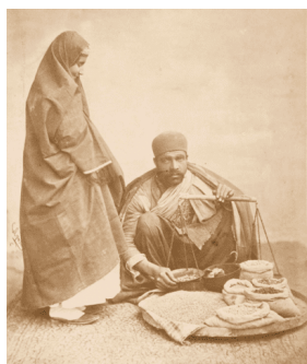
تصویر ۱۰. آجیل فروش

حدود ۱۸۸۰ تا ۱۹۳۰