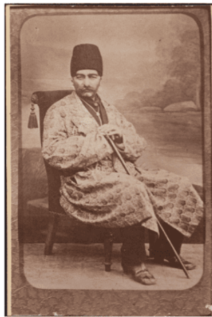
تصویر ۱. پرتره قاجاری