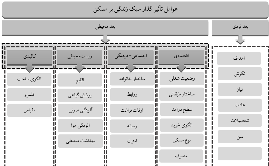
نمودار ۲. مصادیق سبک زندگی مؤثر بر مسکن