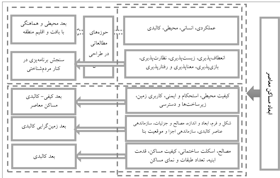
شکل ۱. تحلیل دیدگاه پژوهشگران در مورد مسکن معاصر

براساس مطالعات تحقیقات پیشین، ابعاد مسکن روز از دیدگاه‌های مختلف در نمودار شماره (۱) مطرح شده است.