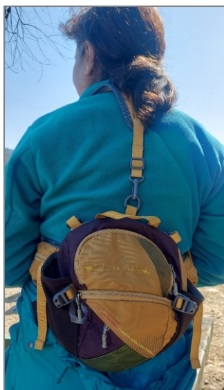
تصویر ۲. کوچ‌نشین دیجیتال و کوله‌پشتی کوچک وسایل ضروری برای بازدید محلی