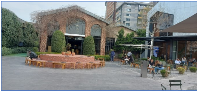
تصویر ۵. محوطه یکی از فضاهای کار اشتراکی زنجیره‌ای Espresso Lab