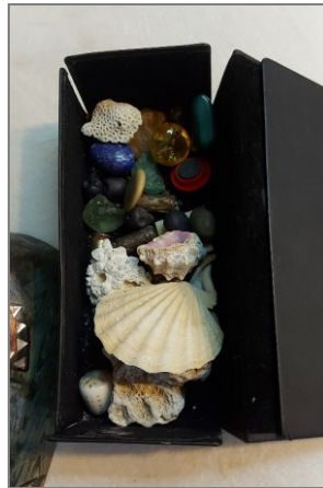
تصویر ۴. جعبه یادگاری‌های یکی از کوچ‌نشینان ایرانی از سنگ‌ها و صدف‌ها