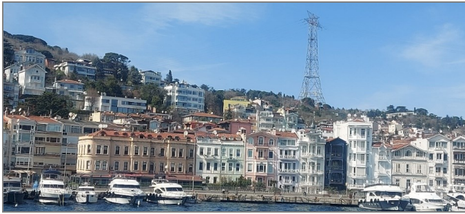
تصویر ۱. نمایی از استانبول در حاشیه تنگه بوسفور

ناسیونالیسم ترکی و پیوند آن با زبان، جدای از دین و عقاید سیاسی، به انسجام فرهنگی و همدلی مردمی انجامیده است. ترکیه و به طور خاص استانبول، طی سال‌های اخیر فارق از تنش‌های اقتصادی و سیاسی نبوده و ناسیونالیسم و عرق ترک‌بودن در شرایط بحرانی به صورت مرزی‌بندی‌هایی میان بومیان و مهاجران آشکار شده است. استانبول با تکرر جمعیتی که دربرگرفته فضایی مناسب برای گم‌شدن و درعین حال برخوردار از عادات‌های شهرنشینی مدرن با امکانات دسترسی بالاست. به گفته ایرانیان مقیم و ترک‌زبان‌هایی که در این سفر همراهان بودند، روند توریستی سال‌های اخیر هزینه زندگی در استانبول را به شدت افزایش داده است. هزینه‌های ثابت زندگی و مالیات بر ارزش افزوده تقریباً شصت درصد درآمد یک خانواده دو نفره را به خود اختصاص می‌دهد. افزایش هزینه‌ها در مقایسه با دیگر کشورها، بسیاری از ایرانیان مقیم ترکیه را به فکر مهاجرت دوم انداخته است.