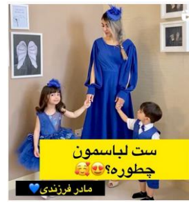
ست لباسمون چطوره؟ 😊😊 مادر فرزندی