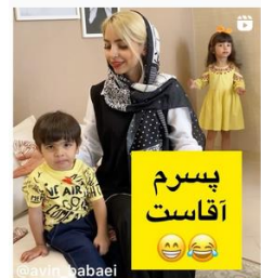
شکل ۶. قاب‌بندی با بیشترین اتصال مادر و پسر و عدم اتصال مادر و دختر

در نوشتار صفات متعددی برای هر یک از کودکان به‌کار برده شده است. برخی صفات همچون صفت «قشنگ»، به‌صورت مشترک هم برای دختر و هم برای پسر بیان شده است. برخی صفات نیز به‌طور خاص و تنها برای دختر و یا پسر به‌کار گرفته شده که کلیشه‌های جنسیتی را نشان می‌دهد. به‌عنوان نمونه، در نوشتار یکی از پست‌ها صفت «قانع» برای دختر استفاده شده است و در پستی دیگر از صفت «زورگو» برای پسر استفاده شده و استفاده از ایموجی‌ها، لذت بردن مادر از این زورگویی و تایید و تشویق این صفت برای پسر را نشان می‌دهد: