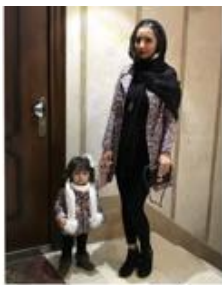
برجستگی مادر با استفاده از وضوح چهره و اندازه نسبی

در تصاویری که مادر و کودکان حضور دارند نیز تصویر مادر برجسته شده است که ارزش اطلاعاتی بیشتر و اهمیت محوری مادر را نشان می‌دهد. در این زمینه به‌عنوان نمونه می‌توان به استفاده از کنتراست و تضاد رنگ پوشش مادر با سایر اعضای خانواده، استفاده از نور و وضوح چهره مادر در کنار چهره تار و ناواضح سایر اعضای خانواده، اندازه نسبی بیشتر مادر در تصویر، قرار گرفتن مادر در مرکز تصویر، استفاده از زاویه افقی روبرو برای مادر و زاویه افقی اریب برای سایر اعضای خانواده و یا نامشخص بودن چهره آنها، اشاره کرد (برجستگی، ارزش اطلاعاتی، نگرش ذهنی معطوف به رابطه).