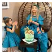
#چالش#تولد#چالش #تولد#میارک#سبز #خانواده#عشق#تولدی#۲۹ سالگی