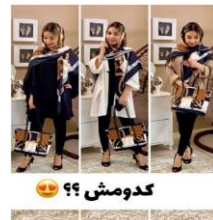
شکل ۹. نمونه‌هایی از مشارکت مادر در تصویر بدون حضور و همراهی کودکان