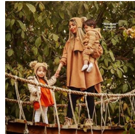
شکل ۱۱. نمونه‌هایی از کنش مادر معطوف به مراقبت از کودک و رسیدگی به امور فرزندان