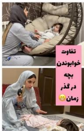
شکل ۱۲. ترکیب‌بندی بالاپایین و نمایش مادر نسل جدید به‌مثابه عنصر آرمانی

چنانچه اشاره شد، در تصاویر ترکیب‌بندی مرکز‌حاشیه غالب است که در آن مادر در مرکز تصویر قرار گرفته و ارزش اطلاعاتی بیشتری دارد. با این حال، در برخی تصاویر به‌منظور مقایسه شرایط گذشته و شرایط کنونی از ترکیب‌بندی بالاپایین و یا چپ‌راست استفاده شده است. در یکی از نمونه‌ها، در تصویر پایین، روزگار گذشته نشان داده شده است که در آن مادری عبوس با استفاده از زور در حال خواباندن کودک بر روی پای خود است. در تصویر بالا، عنصر آرمانی مادر امروزی است که کودک را در تاب مخصوص گذاشته و با صبوری و آرامش در حال خواباندن کودک است و مادری نسل جدید را فداکارانه‌تر و آرمان‌گرایانه‌تر نشان می‌دهد.