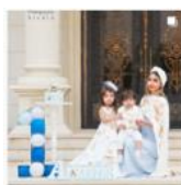
#تولد#تولدت#میارک #تولد#میارک#چشن#بیادکنک #عکس#تولد#آزمین#آبی #سفید#تولدی#کیک#کیکتولد #خانوادگی#خانواده#بیام

پدر هم در تصاویر و هم در نوشتار، حضور و مشارکت بسیار کم‌رنگی دارد. تحلیل میان‌نشانه‌ای بیانگر آن است که در بسیاری از پست‌هایی که در نوشتار آن از هشتگ خانواده استفاده شده است، در تصویر تنها مادر و کودکان حضور دارند و خانواده بدون حضور پدر تعریف شده است (مشارکت).