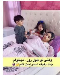
وقتی تو طول روز، میخوام چند دقیقه استراحت کنم 😊😊

شکل ۴. کنش کودکان معطوف به بازی با مادر، به هم ریختن خانه و بیدار کردن مادر از خواب