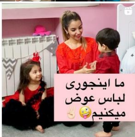
ما اینجوری لباس عوض میکنیم 😊😊