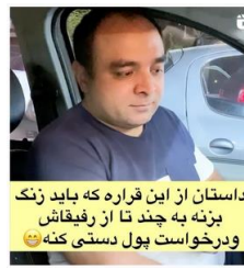
شکل ۱۶. پدر با نگاه عرضه و زاویه افقی مورب، خارج از خانه، در حال رانندگی، حامی مادر

به‌رغم حضور اندک و حاشیه‌ای پدر در تصاویر، در نوشتار از وی با صفات متعددی یاد شده است. برخی از این صفات خطاب به پدر و برخی دیگر در وصف او بیان شده است. در صفات، بیش از همه بر صفت حامی بودن پدر برای مادر تأکید شده است و سایر صفات به‌کاربرده شده، ارزشمند بودن پدر برای مادر، بزرگ‌خانواده بودن و زحمت‌کش بودن پدر از منظر مادر را نشان می‌دهد (فرایند رابطه‌ای توصیفی). در مجموع پدر مطلوب در این صفحه، پدری معرفی شده است که حامی مادر است، حضور بسیار کم‌رنگی در خانه دارد و همواره در حال کار و کسب درآمد است.