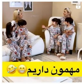
مهمون داریم 😊😊