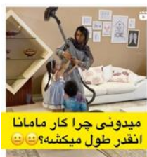
میدونی چرا کار مامانا انقدر طول میکشه؟ 😊😊

پیش‌تر بیان شد که کودکان اغلب بدون کنش و یا در حال بازی با مادر هستند؛ اما در برخی از تصاویر به‌طور خاص دختر در حال کنش است. با این حال، سطح عاملیت و کنش دختر در توانایی رقصیدن او خلاصه می‌شود که تنها در چند تصویر و نوشتار مرتبط با آن نشان داده شده است. در چند تصویر نیز دختر در حال کمک کردن به مادر در انجام امور خانه همچون جارو کشیدن و یا آبمیوه گرفتن است (فرایند کنشی) و این کنش دختر در نوشتار پست از سوی مادر تأیید و تشویق می‌شود. این در حالی است که در این تصاویر پسر نظاره‌گر خواهرش است (فرایند واکنشی) و یا بر اساس آنچه مادر در نوشتار ذکر کرده است، با خرابکاری مانع انجام کار توسط مادر و خواهرش می‌شود. در تصویر دیگر دختر علاقه‌مند به جارو کشیدن و در تلاش برای گرفتن جارو از مادر نشان داده شده است.