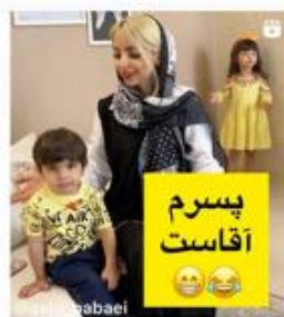
برجستگی مادر با استفاده از ترکیب‌بندی مرکزی (مادر در مرکز و کودکان در حاشیه)