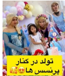
شکل ۸. استفاده از تم تولد سیندرلایی برای دختر و کیک تولد ماشینی برای پسر