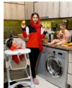
برجستگی مادر با استفاده از ترکیب‌بندی مرکزی (مادر در مرکز و کودکان در حاشیه) و پرسپکتیو افقی (مادر با زاویه روبرو و کودکان با زاویه اریب)