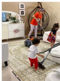
شکل ۱۴. نمونه‌هایی از کنش‌های مادر در راستای انجام امور خانه

بررسی فرایند رابطه‌ای توصیفی برای مادر در نوشتار نیز نشان می‌دهد که مادر از صفات «مادر خوب» و «همسر خوب» به‌عنوان صفات مطلوب خود نام برده است. امیدوارم نگاه خدا امسال هم همراهم باشه، بتونم مادر و همسر بهتری باشم. تمام تلاشمو میکنم که مامان پرانرژی ای براشون باشم.