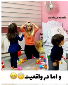
و اما در واقعیت 😊😊