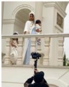
برجستگی مادر با استفاده از پرسپکتیو افقی (مادر با زاویه روبرو و نامشخص بودن چهره کودکان)