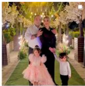
برجستگی مادر با استفاده از کنتراست و وضوح چهره