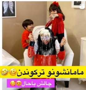
مامانشونو ترکوندن 😊😊 چالش یا حال 😊😊