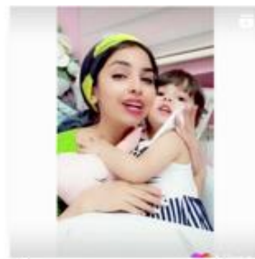
برجستگی مادر با استفاده از کنتراست رنگ سبز در زمینه سفید