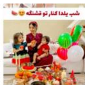
#شب#یادا#تو#تشنه #شب#چله#یادا#۹۹#انار#مندانه #فرمز#خواهر#برادری#خانوادگی #یلدای#لاک#کاست #خانواد#عشق#خانواده#یلدا#در#خانه