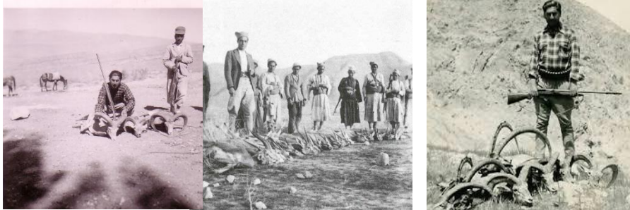
تصویر شماره ۳. شکار خانواده ایلخانی قشقایی