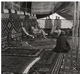
چادر افراد عادی ایل