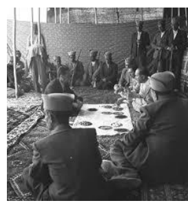
تصویر شماره ۲. کلاه به‌عنوان نماد هویت‌بخش، احترام به ایلخان و آداب تشریفات درون ایلی