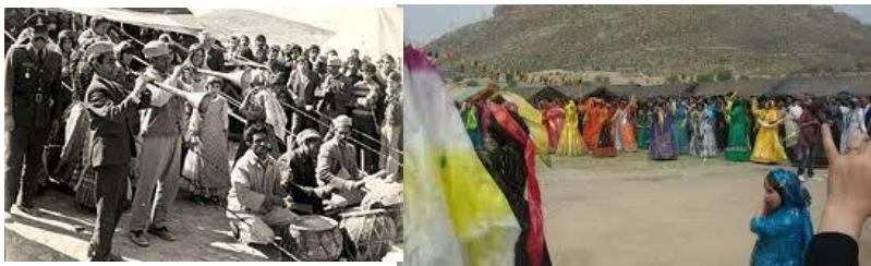
تصویر شماره ۴. مراسم ایلی و بازتولید قدرت

«هنگامی که خان بزرگ ایل، پس از نیم‌قرن انتظار دارای نخستین فرزند ذکور شد، عشایر فارس، غرق در مسرت و نشاط شدند و جشنی باشکوه در چمن مشهور شاه‌نشین، در جلگه‌ای به نام خسرو شیرین برپا کردند. اجاق خاموش خان روشن شده بود. همه روشن و شادمان گشتند. اشک شوق ریختند... با به صدا درآمدن نقاره‌ها، دختران و زنان رنگین‌پوش به شکل قوس و قزحی زیبا حلقه زدند و با زیروبم موسیقی بر فرشی از قلب‌های مشتاقان و هنرپرستان گام نهادند و گل‌های زمینی و ستارگان آسمان را بی‌رونق کردند.» (بهمن بیگی، ۱۳۸۹، ۲۰۲-۲۰۱).