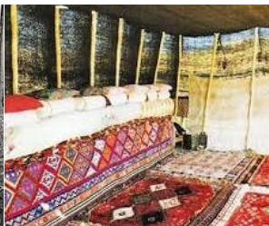
چادر طبقه متوسط